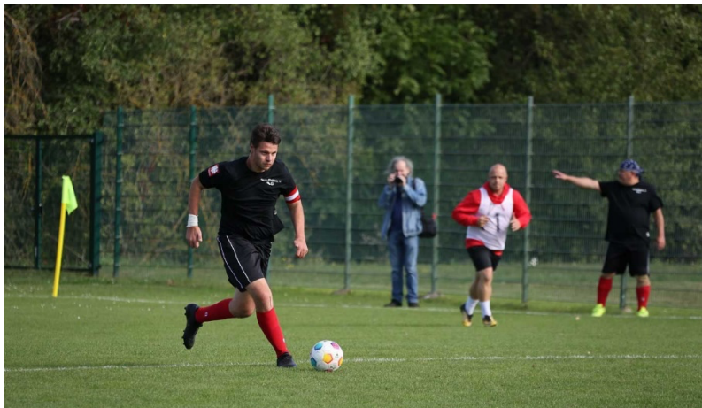
Fußballturnier bei Landesspielen Weißenfels 2023

Ich will gewinnen, doch wenn ich nicht gewinnen kann, so will ich mutig mein Bestes geben!