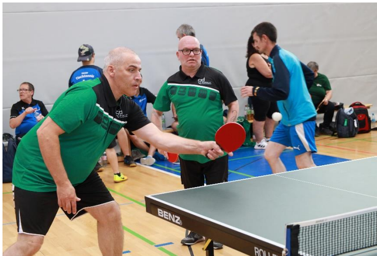
Tischtenniswettbewerb bei Landesspielen Weißenfels 2023

Ich will gewinnen, doch wenn ich nicht gewinnen kann, so will ich mutig mein Bestes geben!