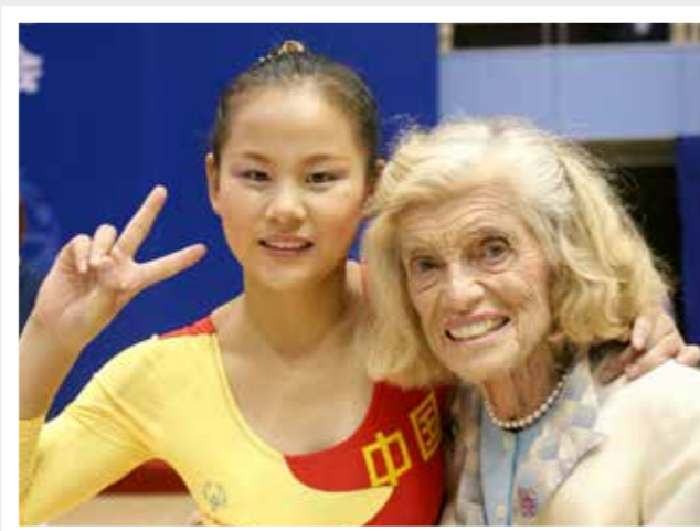
Special Olympics Gründerin Eunice Kennedy Shriver (rechts)